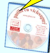
Foto și filme de la curs